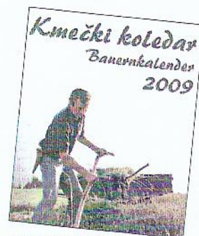
Iz Kmečkega koledarja KIS za leto 2009

Lastno lovišče Najljubši Danielov konjiček je lov, saj ima tudi lastno lovišče. Že kot otrok je spremljal očeta in dedka na lov. Pravi, da mu je pri lovu najlepše to, da se sprehodiš po naravi in si v gozdu. Seveda pa je lepo, kadar kaj uloviš in se lov nato tudi počteno praz-