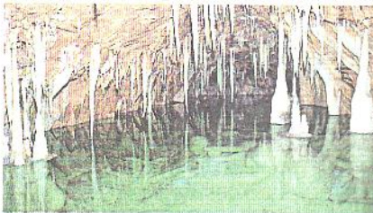
Obirske kapniške jame so doslej beležile rdeče številkke.