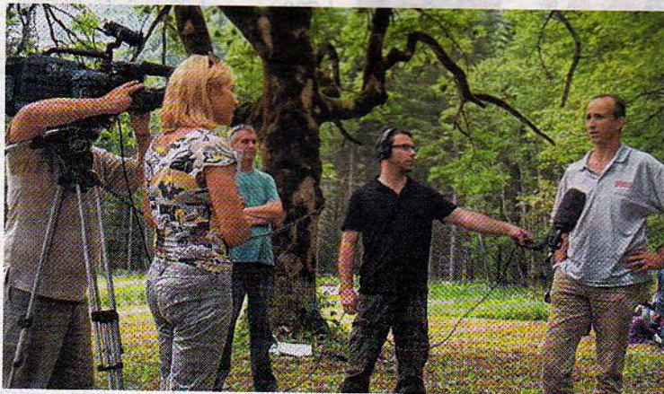
Großes Medieninteresse - hier wird ein italienischer Teilnehmer interviewt