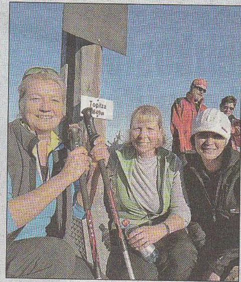
Zahlreiche Bergfreunde waren, begleitet von der Bergrettung, am ersten Adventsonntag zur Gipfelandacht auf die Topica gewandert.