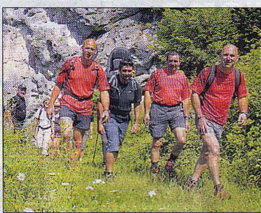
Neben dem Feiern wurde auch gewandert