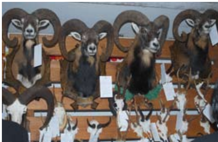
Die Trophäenschau der vier Hegeringe fand heuer im Gasthaus Kovač statt.

Ich danke allen Fraktionen, die sich bei unserer letzten Be-