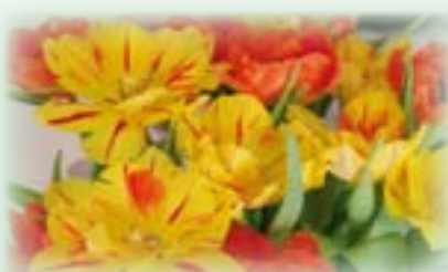
Blumen sind das Lächeln der Erde R. Emerson

Der Bürgermeister der Marktgemeinde Eisenkappel-Vellach mit seinem Team, die Vizebürgermeister sowie die Gemeinderäte wünschen einen schönen Valentinstag!